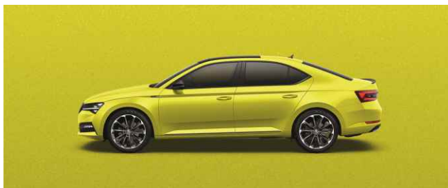
DRAGON SKIN METĀLISKA (Sportline)