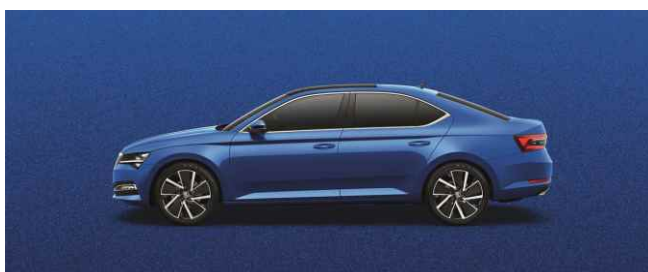
RACE BLUE METĀLISKA